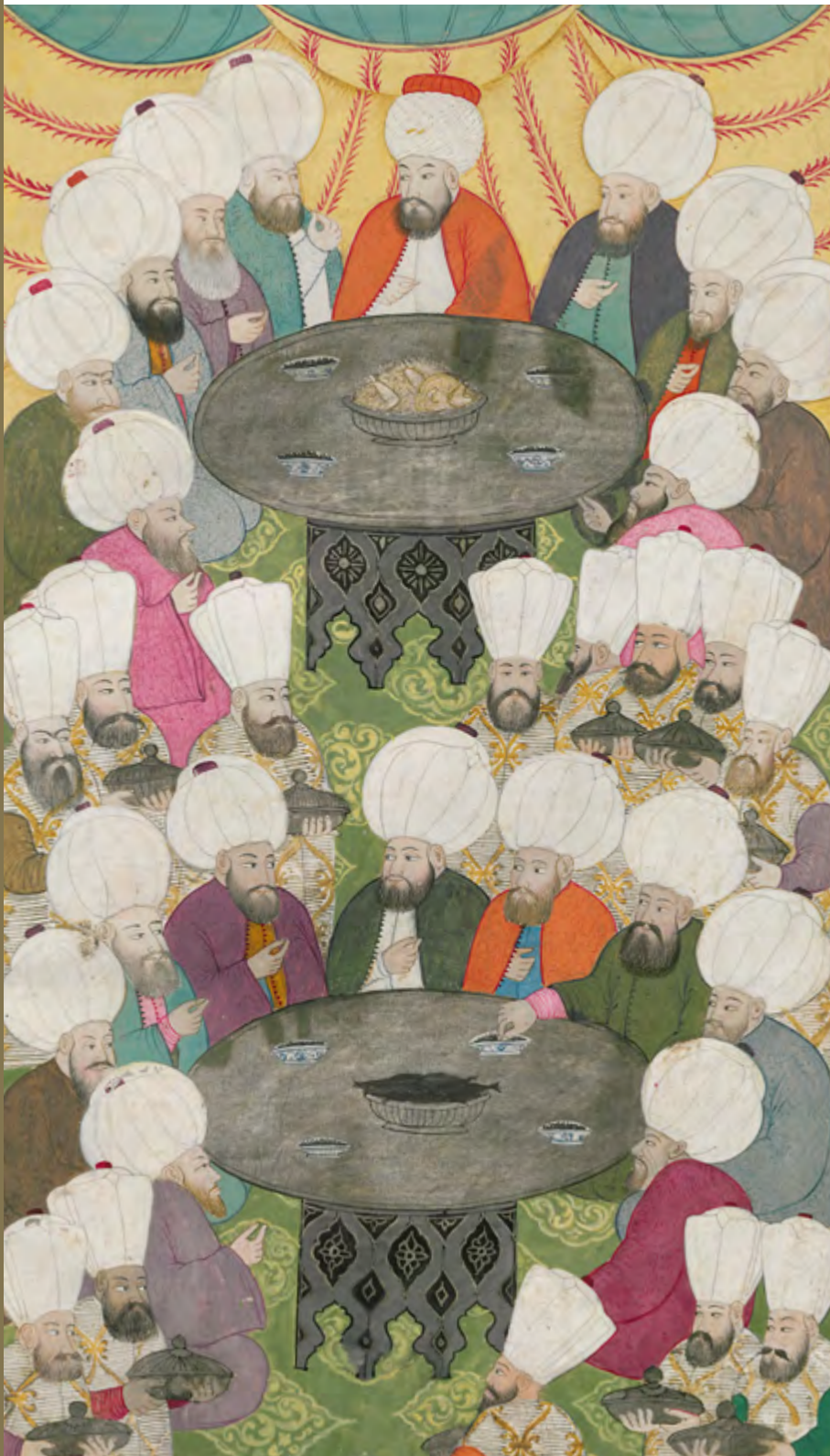
RESİM 1. Müderrislerin Ziyafeti; Şenliğin 3. Günü

Seyyid Vehbi Hüseyin bin Abdullah, Surname-i Vehbi , TSMK, 3. Ahmet Kitaplığı 3594, 73b.