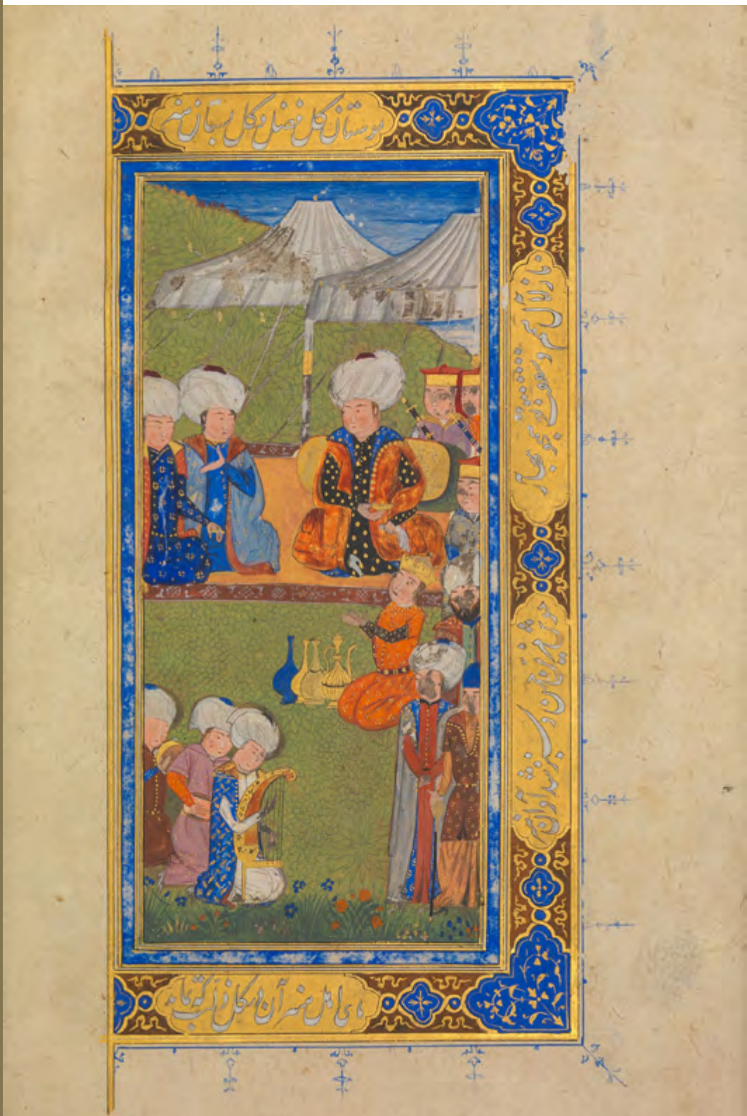
RESİM 3. Şiir Meclisi

Hatifi, Hüsrev ü Şirin , New York Metropolitan Sanat Müzesi [The Metropolitan Museum of Art], N. 69.27, 1v.