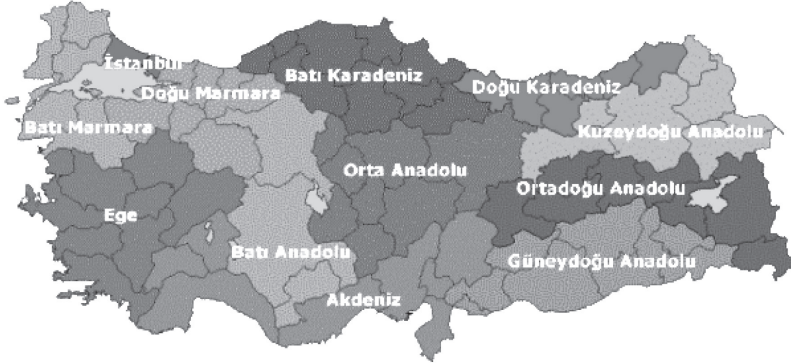
Şekil 1: Araştırma Bölgeleri

Araştırmanın veri toplama aşaması 2013 yılı Ocak-Nisan aylarında gerçekleştirilmiştir. Anket, araştırmanın evrenini temsilen seçilen 81 şehirde ve demografik ölçekle kent kategorisine dâhil edilebilecek ilçeler dâhil 179 kentsel, 173 kırsal olmak üzere toplam 352 yerleşim biriminde 5541 kişiye uygulanmıştır . Araştırmaya katılanların bazı özellikleri (Tablo1-Tablo 10)’da gösterilmiştir.